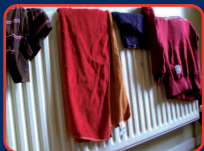
▲ Warmte en water evaporatie