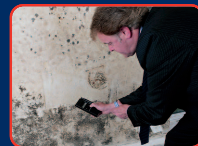
▲ Analyse (consultation)