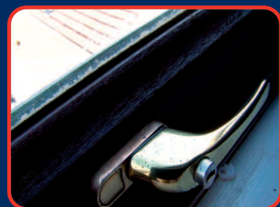
▲ Gebrekkige ventilatie

Schimmels zijn bijna overal te vinden maar kunnen alleen overleven in een vochtige omgeving en die voorkomt bij: