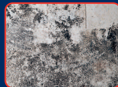
▲ Beschimmelde oppervlakte